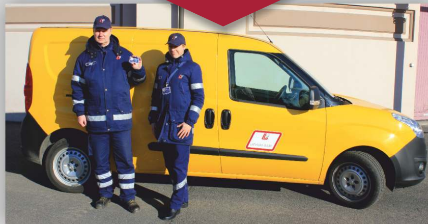
Trafarētas automašīnas un formas tērpa paraugs

Apliecības uzrādītājam avārijas situācijā ir tiesības netraucēti piekļūt dabasgāzes apgādes sistēmām jebkurā diennakts laikā. No plkst. 8.00 līdz plkst. 21.00 AS "Latvijas Gāze" darbiniekiem ir tiesības piekļūt dabasgāzes apgādes sistēmām plānotu pārbaudi veikšanai.