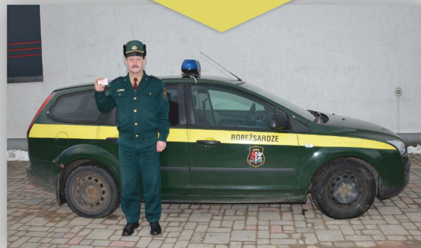
Trafarētas automašīnas un formas tērpa paraugs

Neskaidrību vai konfliktsituāciju gadījumā zvaniet uz bezmaksas uzticības tālruni 80001060 .