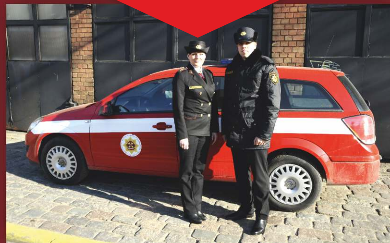
Trafarētas automašīnas un formas tērpa paraugs

Ja neesat pārliecināts, vai šāda amatpersona strādā Valsts ugunsdzēsības un glābšanas dienestā, zvaniet pa tālruni 67075824 vai meklējiet informāciju www.vugd.gov.lv/kontakti .