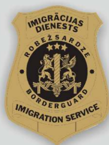
Valsts robežsardzes apliecības un žetona paraugs

Īpaša piesardzība jāievēro, ja atnākusī persona nav Valsts robežsardzes formas tērpā. Pildot dienesta pienākumus, Valsts robežsardzes amatpersonai jābūt formas tērpā.