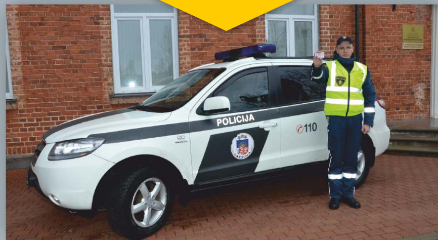
Trafarētas automašīnas un formas tērpa paraugs

Īpaša piesardzība jāievēro, ja atnākusī persona nav Valsts policijas formas tērpā. Šādos gadījumos noteikti jāpārliecinās, vai amatpersona strādā policijā, zvanot pa tālruni 110 .