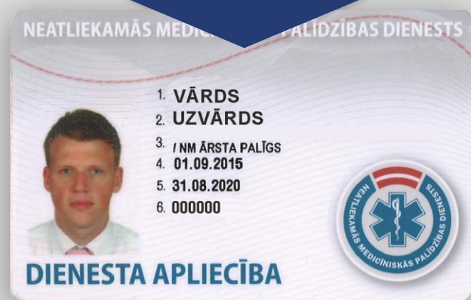
Neatliekamās medicīniskās palīdzības dienesta darbinieka apliecības paraugs

Nepieciešamības gadījumā Neatliekamās medicīniskās palīdzības dienesta darbiniekam var lūgt uzrādīt dienesta apliecību.