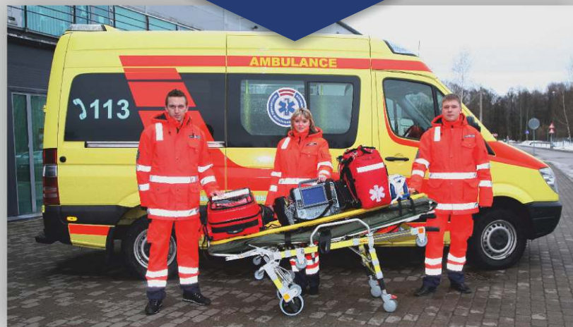
Trafarētas automašīnas un formas tērpa paraugs

Parūpējieties, lai mājdzīvnieki atrodas citā istabā un netraucē mediķu darbam. Redzot saimnieka slikto pašsajūtu, suns var domāt, ka mediķis vēlas nodarīt tam pāri, un cenšas saimnieku pasargāt reļot un rūcot, savukārt kaķi bieži izrāda interesi par aprīkojumu un medikamentiem un var tos sabojāt.