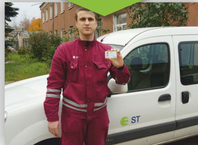
Trafarētas automašīnas un formas tērpa paraugs

Ja rodas aizdomas par personu, kas Jūsu īpašumā vēlas veikt elektrotīkla (arī elektroenerģijas skaitītāja) pārbaudi vai maiņu, zvaniet uz bezmaksas tālruni 80200403 un pārliecinieties, vai persona ir AS "Sadales tīkls" darbinieks!