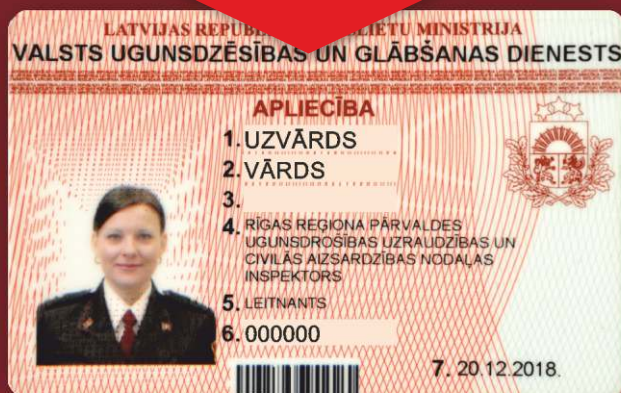
Valsts ugunsdzēsības un glābšanas dienesta darbinieka apliecības paraugs

Pārbaudes laikā amatpersonai ir tiesības arī fotografēt un izdarīt videoierakstus.